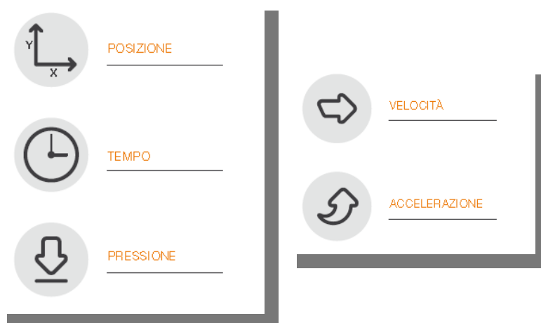
Fig.1 - Schema

E' possibile elaborare velocità e accelerazione ai fini di analisi forensi.