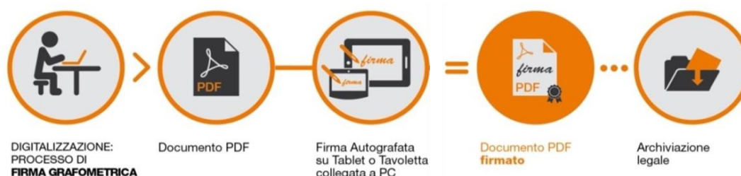
Fig.2 - Schema

I dati cifrati vengono successivamente inseriti nel pdf attraverso la creazione di una firma conforme allo standard europeo denominato PAdES. La soluzione prevede che, a sigillo di ogni firma apposta sul documento dal CLIENTE, sia applicato un certificato rilasciato da NAMIRIAL CA.